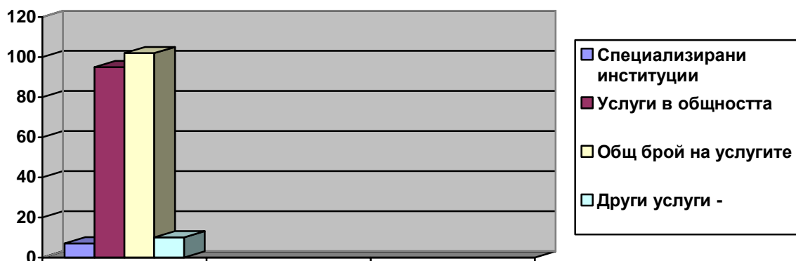
Разпределение на социалните услуги в област Плевен по категории – Диаграма 2

Специализираните институции на територията на област Плевен са 7 на брой и заемат 6,9% от общия дял на социалните услуги. Четири от тях предоставят услуги за деца и съответно 3 за възрастни. Една от услугите се предоставя като частна дейност, всички останали са ДДД.